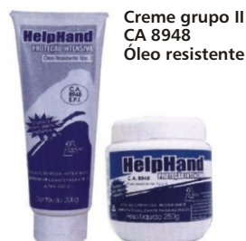
Creme grupo II CA 8948 Óleo resistente

Eficiente contra: Óleos graxos, solventes, lâ de vidro, pó químico, pigmentos, cimento, verniz, colas, cera e cal.