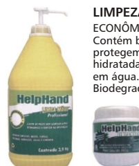
LIMPEZA PESADA ECONÔMICO (1600 DOSAGENS) Contém bactericidas e óleos naturais que protegem a pele contra dermatite. Deixa as mãos hidratadas, secas e macias. Totalmente solúvel em água. Não entope encanamentos. Biodegradável. Atóxico.

Biodegradável inócuo, atóxico. Não entope encanamentos