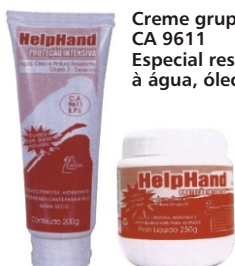
Creme grupo III CA 9611 Especial resistente à água, óleo e pintura

Eficiente contra: Óleos graxos, solventes, lâ de vidro, pó químico, pigmentos, cimento, verniz, colas, cera e cal.